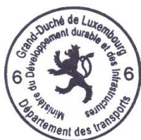
Marco FELTES Inspecteur Principal 1 er en rang

Pour le Ministre du Développement durable et des Infrastructures